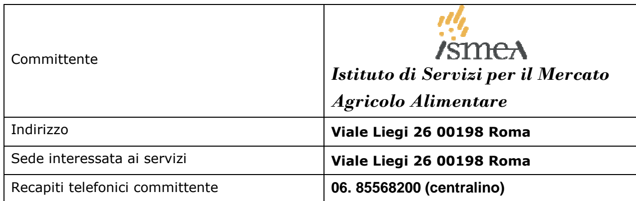
FIGURE DI RIFERIMENTO

Al fine di stabilire la linea di comando e le persone di riferimento dell'appalto vengono di seguito riportati i nominativi dei responsabili: